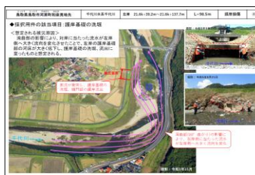
図1: 河川災害復旧事業申請資料