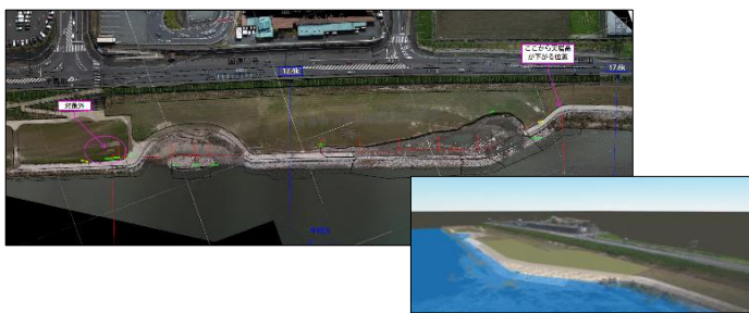
図3: UAV写真点群測量による断面図化で復旧検討とCIMモデル作成