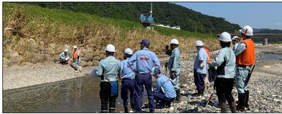
写真1: 合同現地踏査による復旧方針、起終点決定